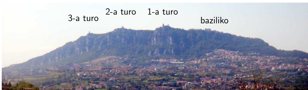
La orienta flanko de Monto Titano, kun la tri turoj kaj la baziliko

La historia centro situas sur la okcidenta flanko de la monto kaj prezentas grandajn nivel-diferencojn; multaj stratoj estas deklivaj. De malsupre (bus-stacio) oni eniras ĝin tra la pordo de Sankta Francisko, kies preĝejo estas proksima. Centre troviĝas la Publika Palaco, sidejo de la registaro, kun statuoj de Libero. Ĉe la norda fino de la monto troviĝas la supra stacio de la telero al Borgo Maggiore. Tie eblas vidi ĝis la marbordo, kiam la aero estas klara. Sur ŝtuparoj laŭ la suda muro eblas iri supren ĝis la Unua Turo, Oni preterpasas la mezlernejon, kie jam plurfoje okazis SUS-aranĝoj. La Dua kaj Tria Turoj situas ekster la muroj, pli sude.