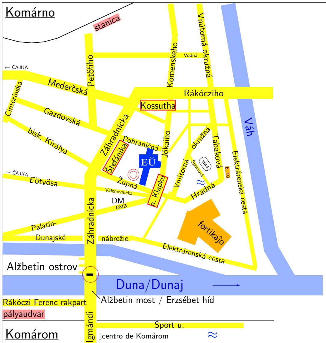
Skiza stratplano de Komárno (SK). Duobla cirklo markas la SUS-ejon. Informoj sen garantio. AIS San-Marino.