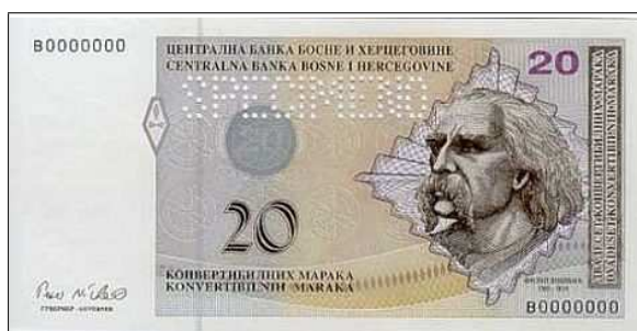
Bildo 1: Monbileto de 20 konverteblaj markoj

ISKanoj, kies servobonhavo havas krediton de almenaŭ 0,5 AKU, povas deprenigi la kotizon de ĝi. Dumvivaj subtenaj membroj kaj studentoj kun valida studenta numero ne pagas SUS-kotizon, se ili aliĝas minimume unu monaton antaŭ la sesio; poste ili pagas 0,2 AKU.